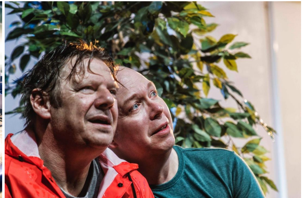
Pressebilleder fra forestillingen med tilladelse fra Teatergrad. Fotograf: Per Morten Abrahamsen